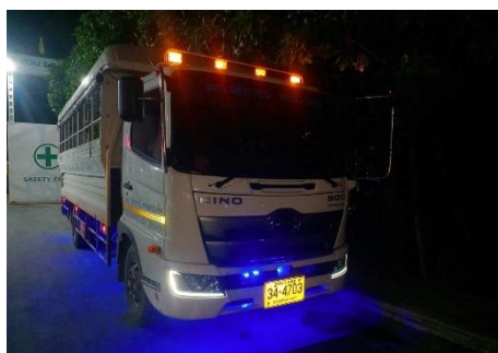
รูปที่ 36 รถรับส่งประจำโครงการ