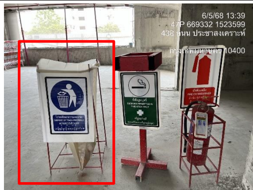
รูปที่ 28 จุดรองรับมูลฝอย