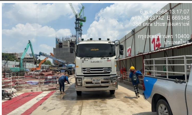
รูปที่ 13 เจ้าหน้าที่ฉีดล้างล้อรถ (ต่อ)