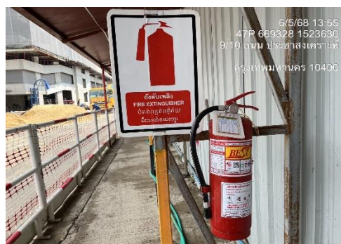
รูปที่ 44 ถังดับเพลิง