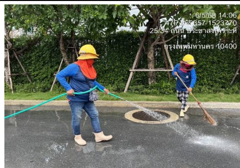
รูปที่ 17 เจ้าหน้าที่ทำความสะอาดบริเวณถนน