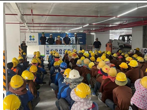
รูปที่ 23 safety talk -morning talk