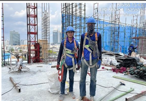
รูปที่ 37 อุปกรณ์ป้องกันอันตรายส่วนบุคคล (สวมใส่) (ต่อ)