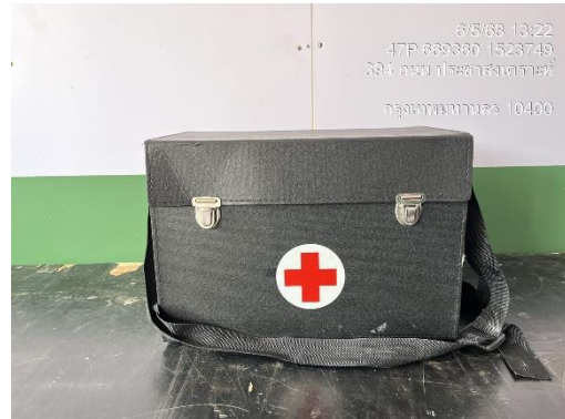
รูปที่ 35 กล่องปฐมพยาบาล