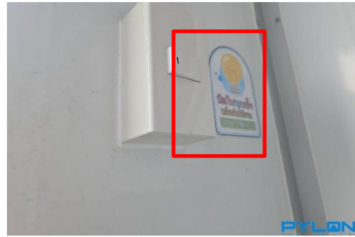
รูปที่ 31 ป้ายรณรงค์ประหยัดไฟ