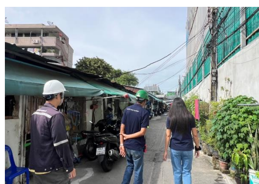
รูปที่ 21 เจ้าหน้าที่เข้าพบบ้านข้างเคียง