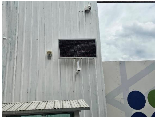
รูปที่ 18 จอแสดงผลตรวจ Real time