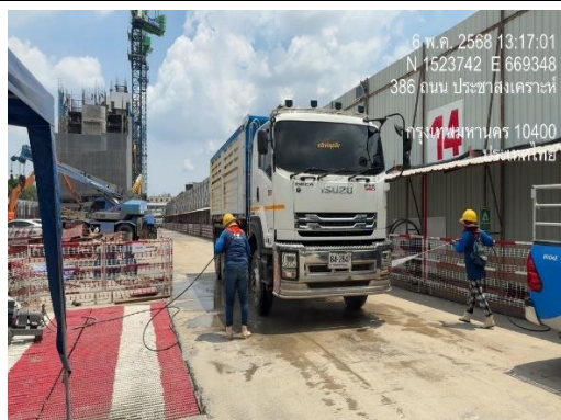
รูปที่ 13 เจ้าหน้าที่ฉีดล้างล้อรถ