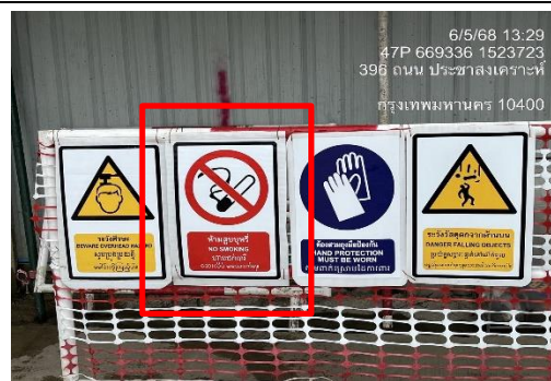
รูปที่ 38 ป้ายห้ามสูบบุหรี่