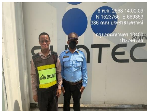
รูปที่ 12 เจ้าหน้าที่รักษาความปลอดภัย (รปภ.)