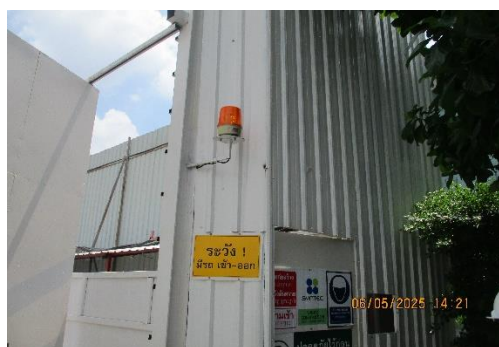
รูปที่ 43 ไฟกระพริบ