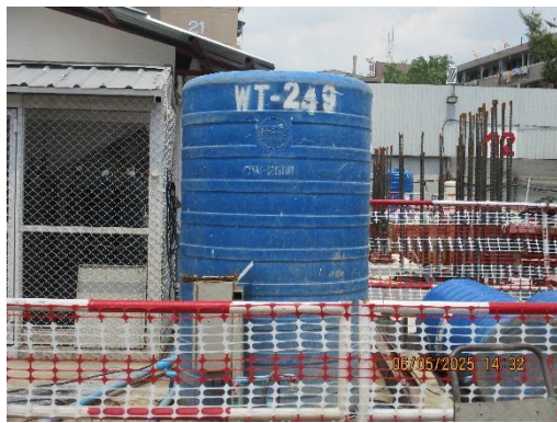
รูปที่ 25 ถังสำรองน้ำใช้