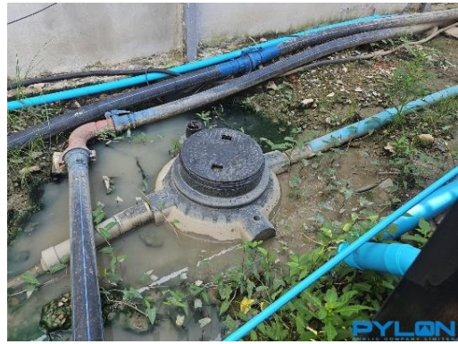
รูปที่ 24 ห้องน้ำ ห้องส้วม พร้อมติดตั้งระบบบำบัดน้ำเสีย