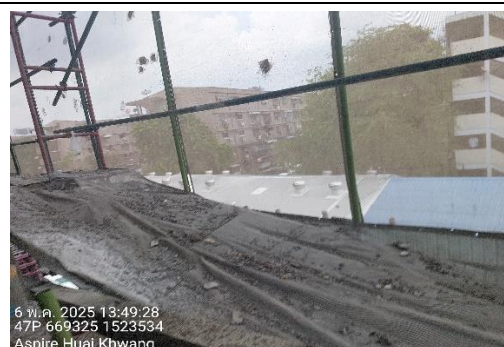
รูปที่ 40 ติดตั้งตะแกรงป้องกันวัสดุตกหล่นโดยรอบอาคาร