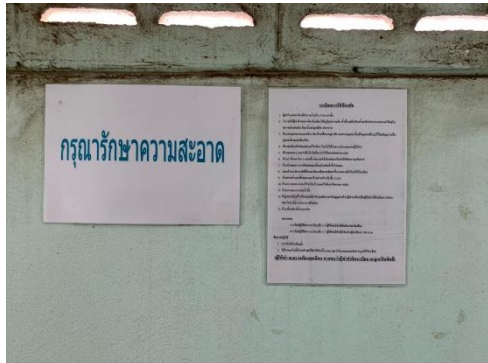
รูปที่ 34 กฎระเบียบบ้านพักคนงาน