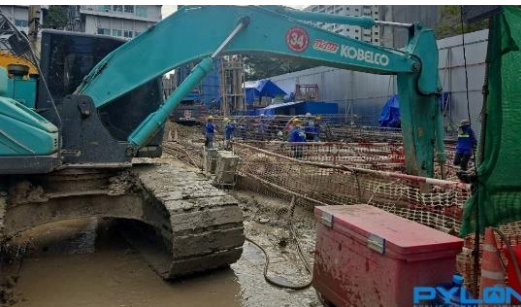
รูปที่ 27 ขุดลอกตะกอนบ่อดักตะกอน