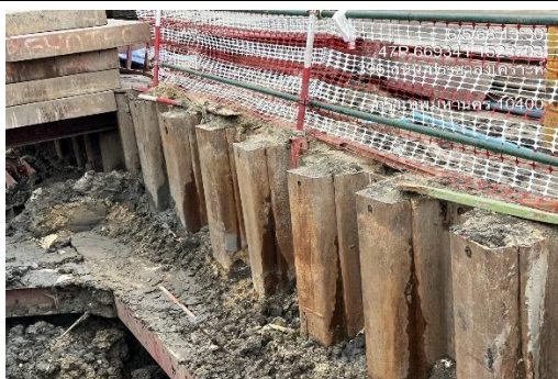
รูปที่ 41 Sheet Piles