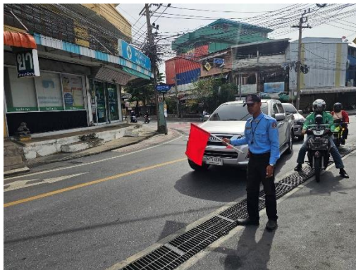
รูปที่ 32 เจ้าหน้าที่ดูแลการจราจร