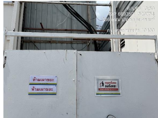
รูปที่ 19 ป้ายห้ามเผาขยะ