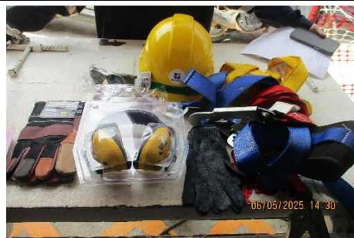
รูปที่ 37 อุปกรณ์ป้องกันอันตรายส่วนบุคคล (ยูนิสไตร)