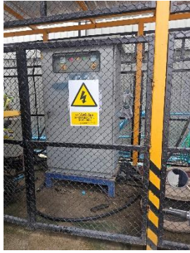
รูปที่ 30 หม้อแปลงชั่วคราว