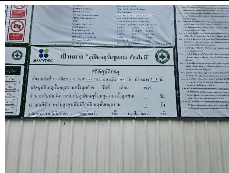
รูปที่ 42 ป้ายสถิติความปลอดภัย