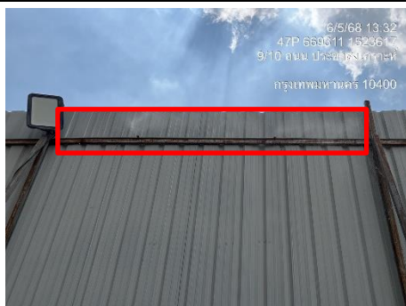
รูปที่ 16 สเปรย์ฉีดพ่นน้ำ