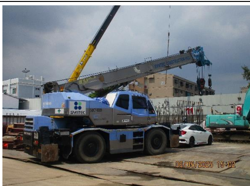
รูปที่ 14 ป้ายชื่อรถบรรทุก