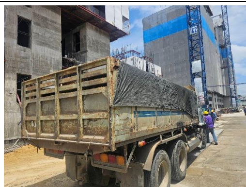
รูปที่ 15 ผ้าใบปิดคลุมท้ายรถ