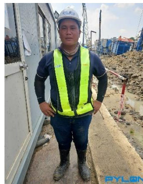
รูปที่ 20 ผู้ควบคุมคนงาน