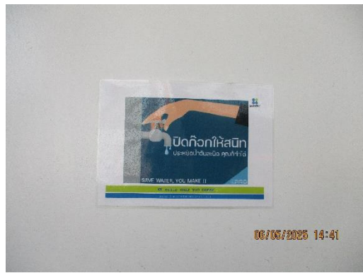
รูปที่ 26 ป้ายรณรงค์ประหยัดน้ำ