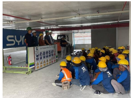
รูปที่ 33 ยูนิฟอร์มคนงาน