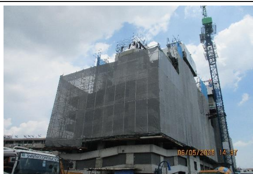
รูปที่ 39 ผ้าใบกันฝุ่น (Mesh sheet)